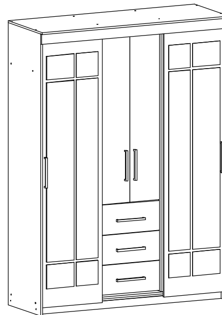
Комфорт № 6 Б Шкаф-купе

Уважаемые покупатели, рекомендуем доверить сборку Вашей мебели профессиональным сборщикам